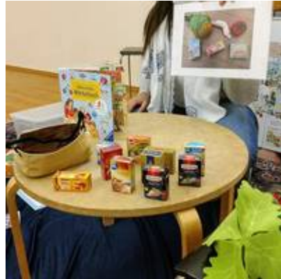
Bücherspaß - erste Worte Deutsch

Weitere Informationen zu aktuellen Angeboten der internationalen Stadtbibliothek Mannheim finden Sie hier!